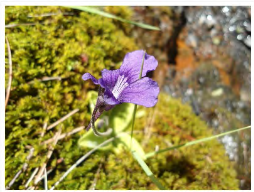
La route du fer - Andorre