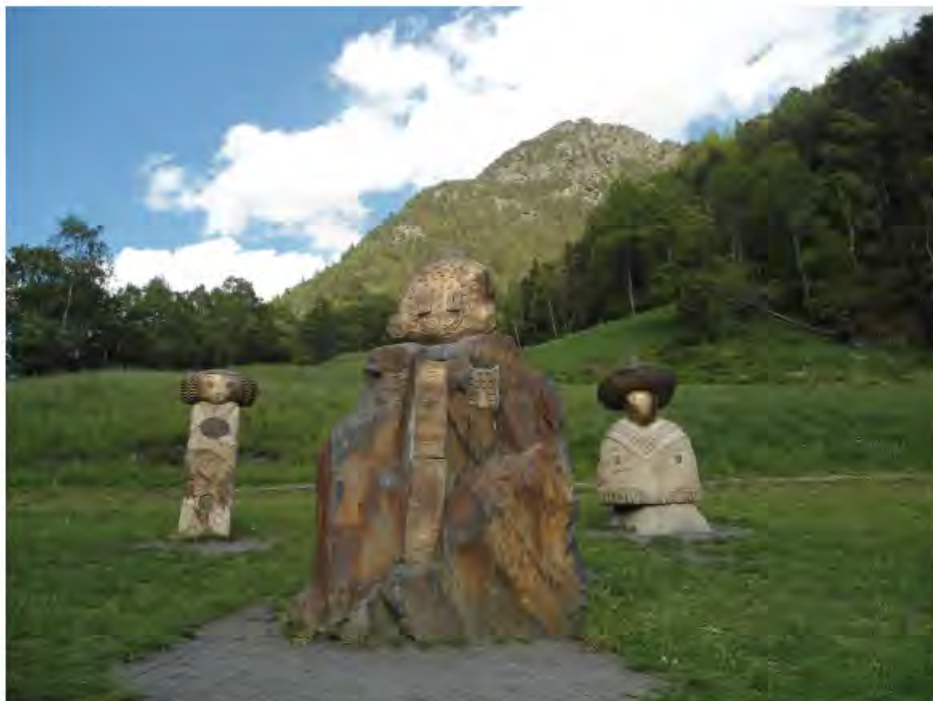
La route du fer - Andorre

En Andorre ce ne sont pas les chemins de randonnées qui manquent avec les Pyrénées en arrière plan où que l'on pose les yeux. Si on n'est pas de nature très sportive mais qu'on veut se mettre au vert malgré tout, la route du fer est idéale. Cette petite balade d'une heure minimum (beaucoup plus si on redescend toute la vallée ou si on s'enfonce dans les sentiers) commence aux portes de l'ancienne mine de Llorts à Ordino et propose de découvrir des œuvres en fer réalisées par des artistes d'ici et d'ailleurs, le long d'un chemin très accessible à tous. Au passage, on pourra enjamber un charmant ruisseau d'eau ferrugineuse (on l'a même goûtée !) qui donne au décor sa touche « carte postale », croiser des troupeaux de chevaux de traie, essayer de deviner quelles sont toutes ces petites fleurs sur le bord du chemin... tout en bronzant sous le soleil andorran. Une jolie balade que l'on a beaucoup aimée, idéale pour se ressourcer au plus près de la nature !