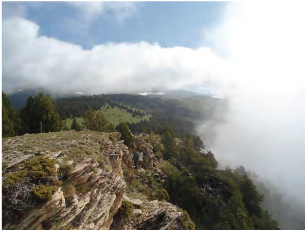
Au-dessus des nuages – Andorre

Naturlandia, c'est aussi un parc animalier depuis un an, qui compte un trio d'ours bruns dont le second mâle de toute les Pyrénées, Julio. Des loups de Sibérie, quelques mouflons, des chèvres et bientôt des marmottes complètent le décor encore en construction, qui proposera également à l'été prochain un parcours interactif pour les enfants, autour des ours.