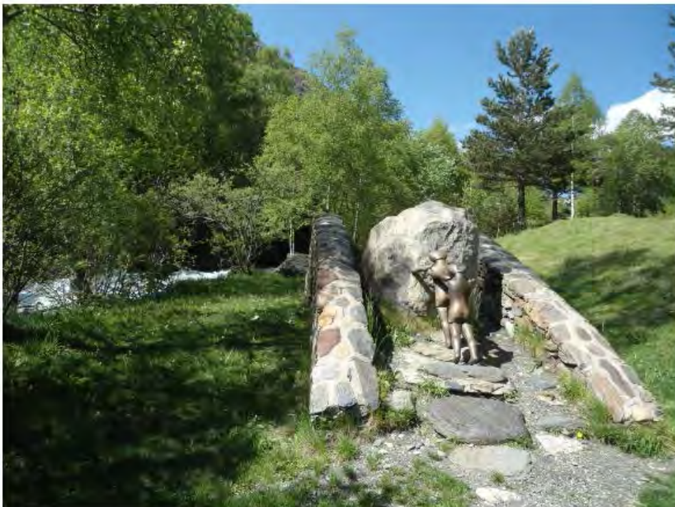
La route du fer - Andorre