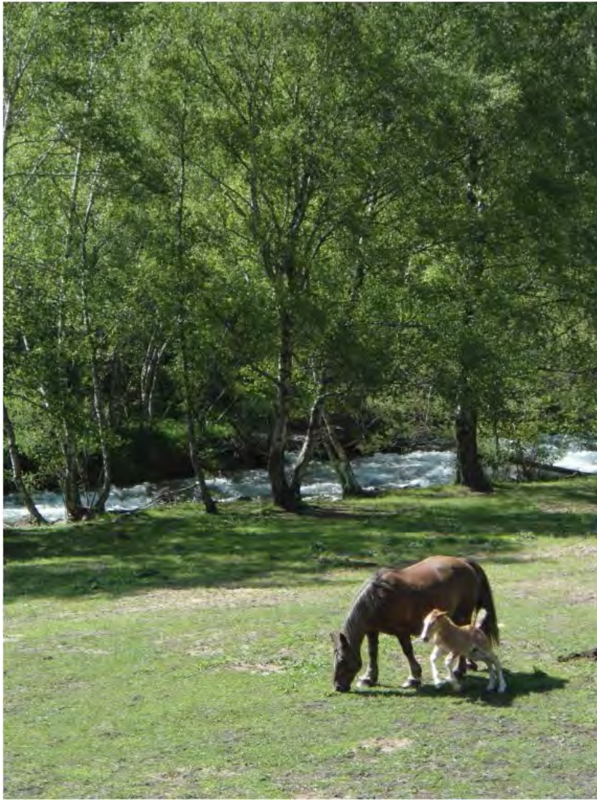
La route du fer - Andorre