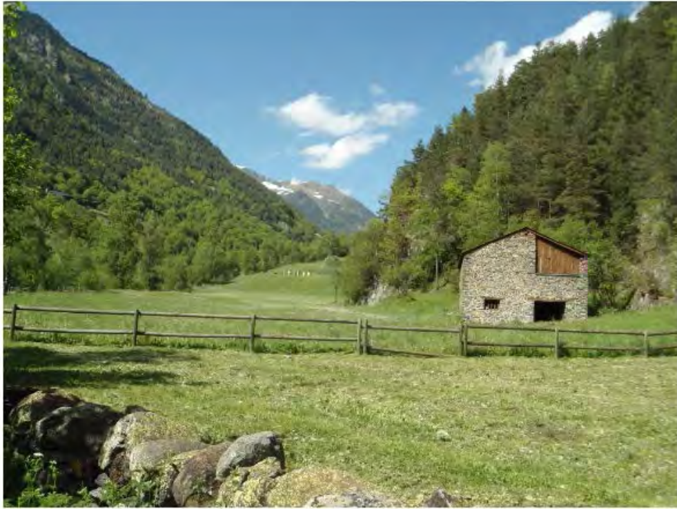
La route du fer - Andorre