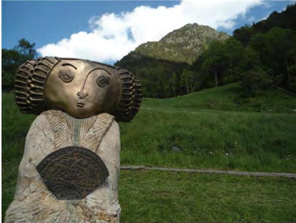
La route du fer - Andorre