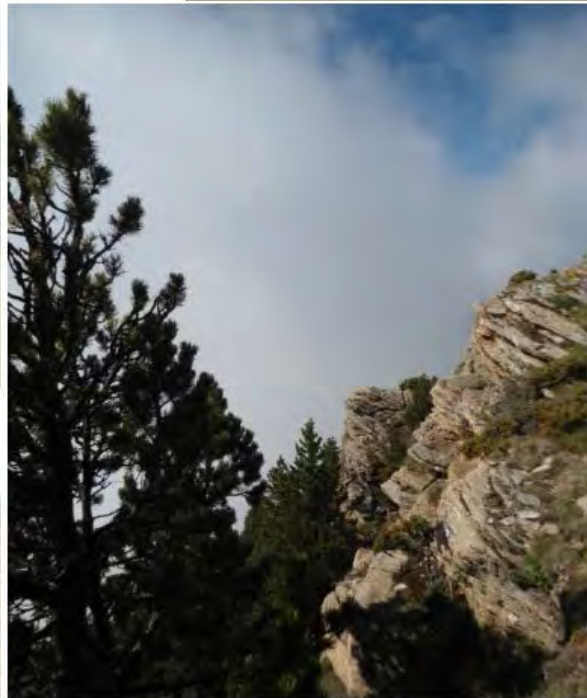
Naturlandia - Andorre