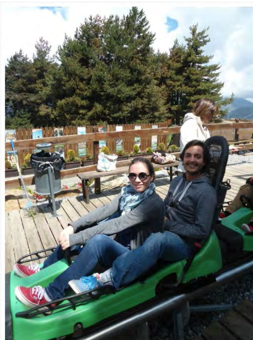
Prêts pour le tobotronc - Andorre

L'autre activité hyper sympa qu'on a eu également l'occasion de tester, c'est le tobotronc . Comprenez une sorte de bobsleigh filant à toute allure sur un parcours en métal pour une petite session de sensations fortes qui réveille. On peut grimper à deux ou tout seul dans sa petite luge puis attendre de se laisser tracter avant de redescendre à grande vitesse vers la ligne d'arrivée. Au départ, la balade au milieu des arbres est plutôt tranquille et permet d'apprécier le paysage. Ensuite, c'est un vrai moment de pur fun qu'on a particulièrement adoré !