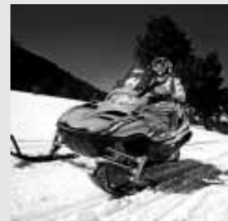
Paseo en motos de nieve.