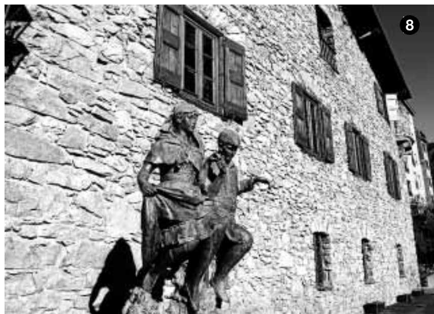
CON ENCANTO. 1▷ Andorra La Vella. 2▷ Espacio 'wellness' del Hotel Plaza Andorra. 3▷ Productos típicos andorranos en El Rebos del Padrí. 4▷ Restaurante del Hotel Plaza Andorra. 5▷ Habitación del Hotel Holiday Inn. 6▷ Kid Suite temática del Hotel Ski Plaza, de Canillo. 7▷ Estancia del Museo Casa Rull, de Sispony. 8▷ Casa de la Vall.

que agua, luz y música se fusionan en un mundo fantástico.