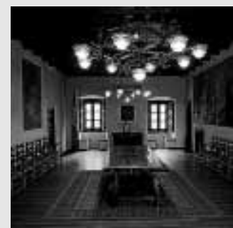
Sala de los Pasos perdidos.

Situada al norte de Andorra, con más de 100 pistas y seis estaciones diferentes, Grandvalira es hoy el dominio esquiable más grande de los Pirineos. La estación es apta tanto para expertos como para los que prueban por primera vez el esquí o el snowboard, con áreas específicas para principiantes y numerosas zonas de ocio infantil. Grandvalira destaca también por su amplia oferta de ocio para no esquiadores. En la estación es posible realizar todo tipo de actividades, desde marchas nórdicas, esquí de travesía o los cada vez más populares paseos en raquetas, hasta el mushing , motos de nieve o construcción de iglús.